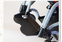
AÇISI AYARLANABİLİR VE UZATILABİLİR AYAK PALET