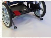
DEVRİLME ÖNLEYİCİ TEKERLEKLER