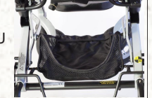
ALT EŞYA DEPOSU