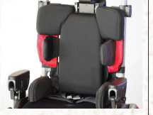
SKOLYOSU KONTROL EDEN GÖVDE KALÇA/UYLUK KAMALARI