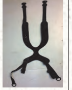
NEOPREN 4 NOKTALI GÖĞÜS TEK PARÇALI